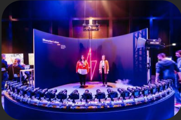
360° Fotobox der illwerke vkw