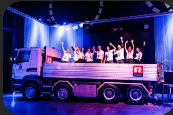
Rhomberg Bau: LKW in der Konferenz