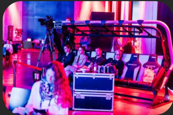
Sessellift von Doppelmayer