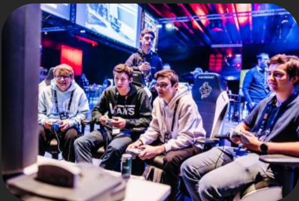
Gaming Lounge der WAG